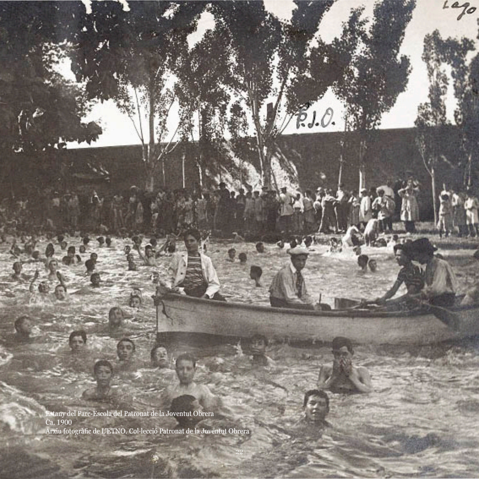
Estany del Parc-Escola del Patronat de la Joventut Obrera Ca. 1900