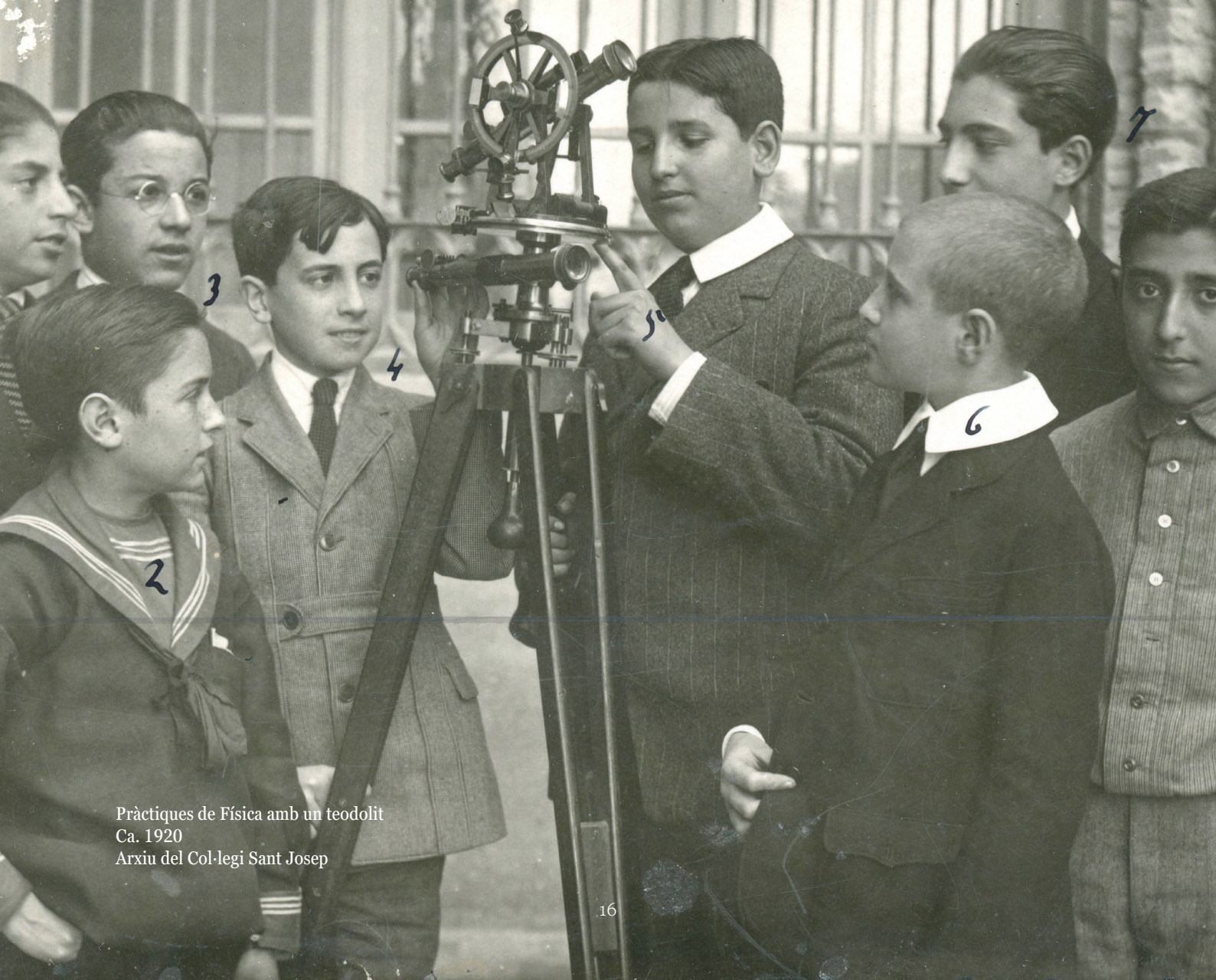
Pràctiques de Física amb un teodolit Ca. 1920