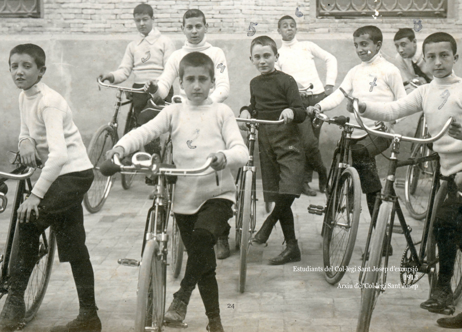
Estudiants del Col·legi Sant Josep d'excursió 1913

Pedro Arrupe a la Federació Europea d'Antics Alumnes, València 1973