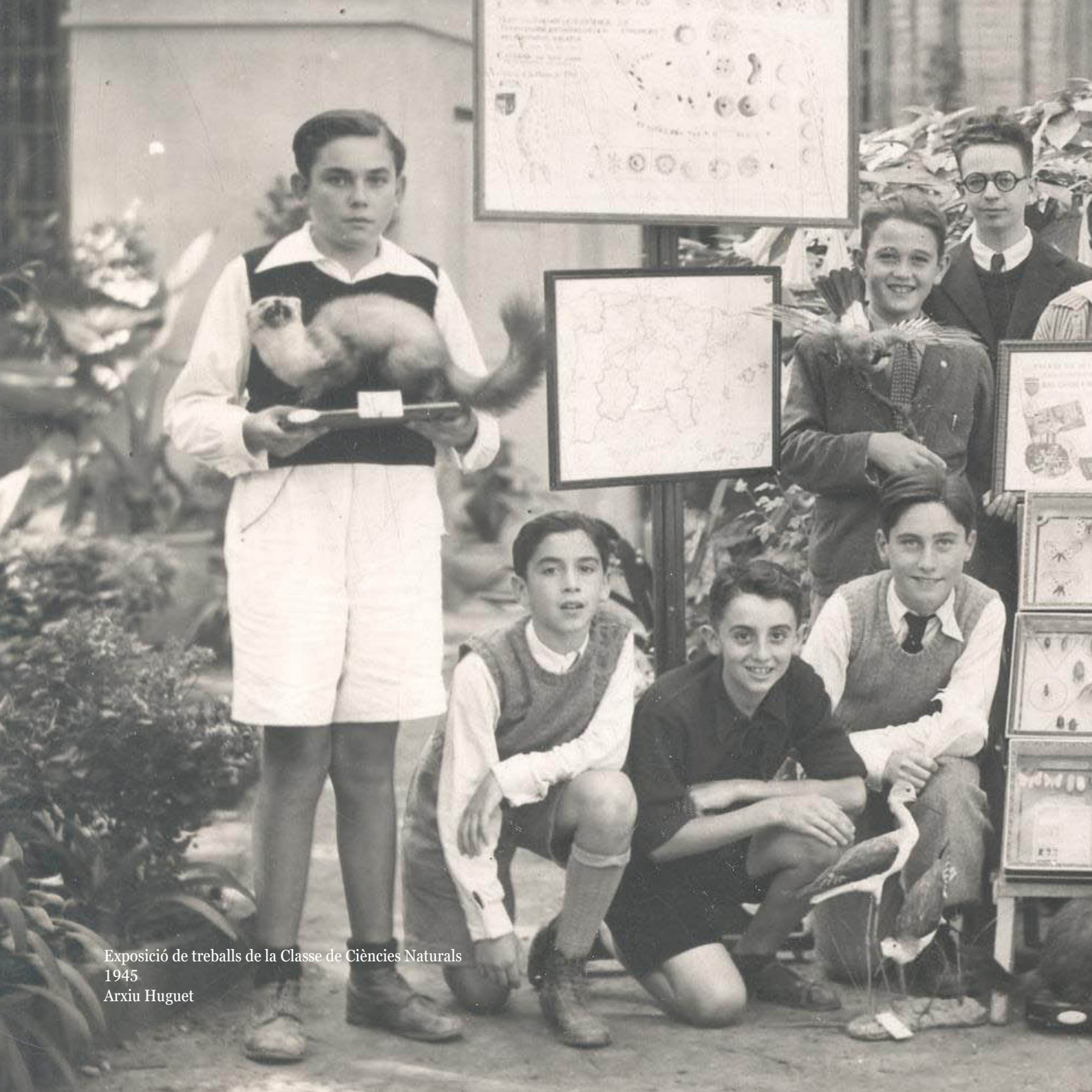
Exposició de treballs de la Classe de Ciències Naturals 1945