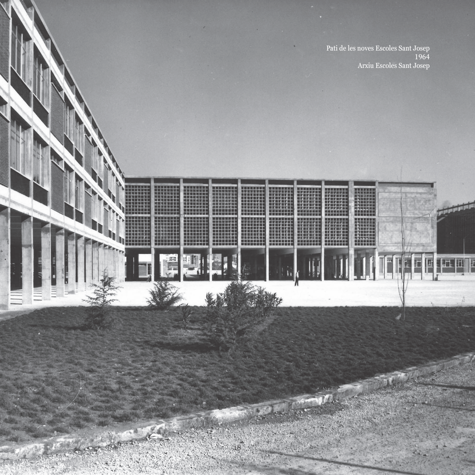
Pati de les noves Escoles Sant Josep 1964