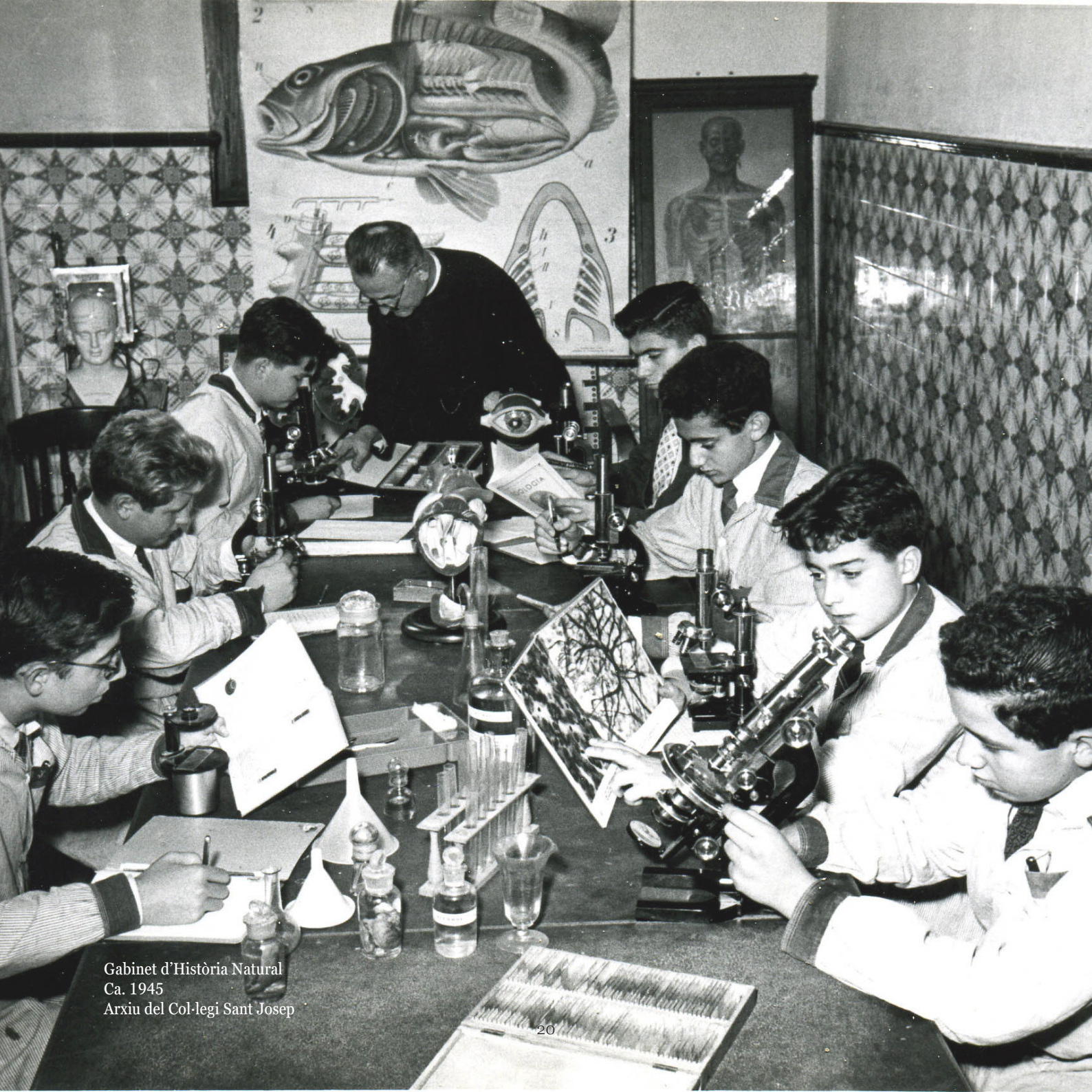
Gabinet d'Història Natural Ca. 1945 Arxiu del Col·legi Sant Josep