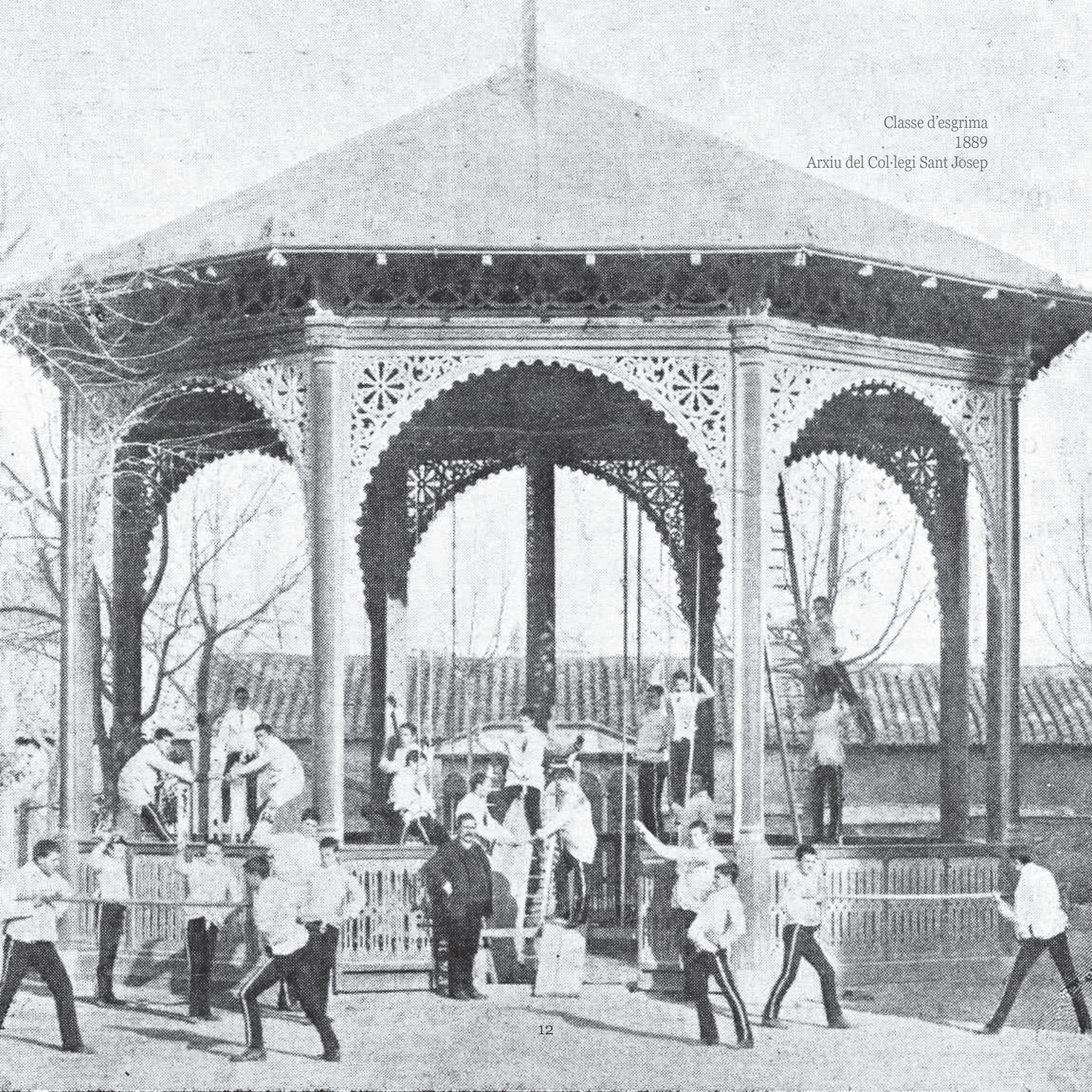
Classe d'esgrima 1889