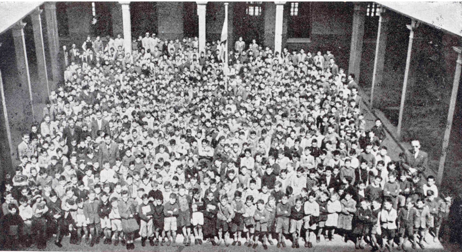
Inauguració del curs en les Escoles Gratuïtes 1948 Arxiu del Col·legi Sant Josep