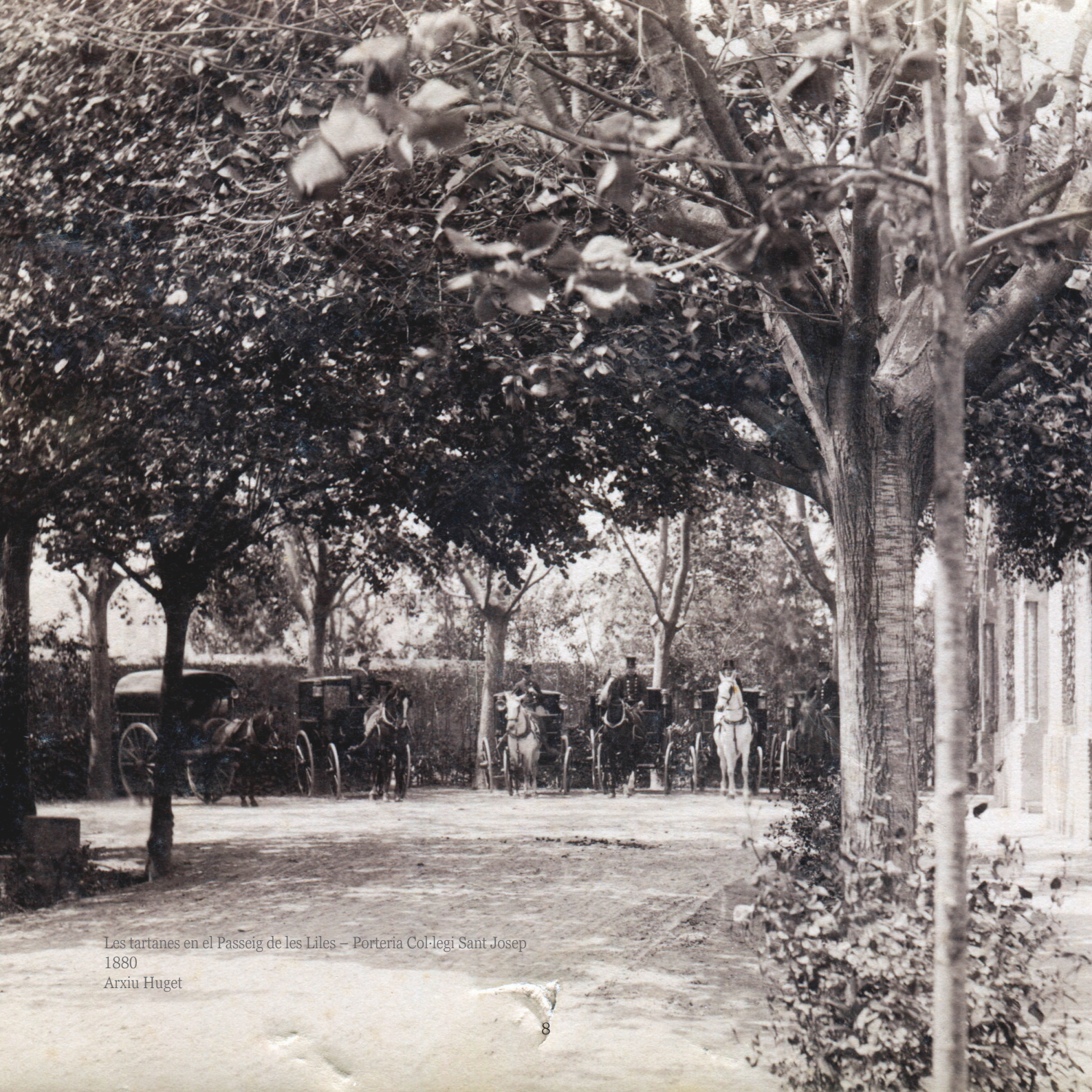
Les tartanes en el Passeig de les Liles – Porteria Col·legi Sant Josep 1880